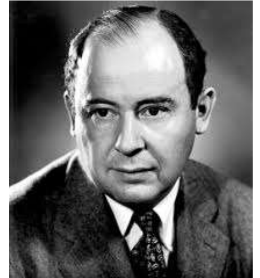
Джон фон Нойман

Аксиому регулярності запропонував Джон фон Нойман, який теж довів, що ця аксіома не суперечить решті аксіом Цермело – Френкеля, проте її наявність значно спрощує розуміння структури теоретико-множинного універсуму.